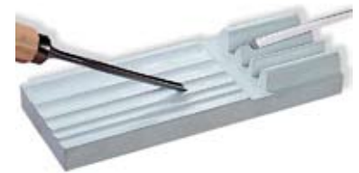
9. Brýnslusett 6.950 kr. Settið sem dugar í hnífa og útskurðarjárn