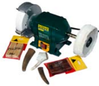
5. Póleringavél 24.850 Hentar í slípun á horni, málm og í brýnslu verkfæra.