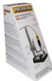
14. Proxxon fræsarastandur 36.239 kr. Frábært í borun og fræsun á fjölbreyttum verkefnum