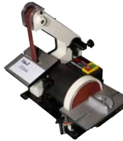
8. Sandslípivélín axminster 19.500 kr. Hljóðlát og hentar í fjölbreytt handverk