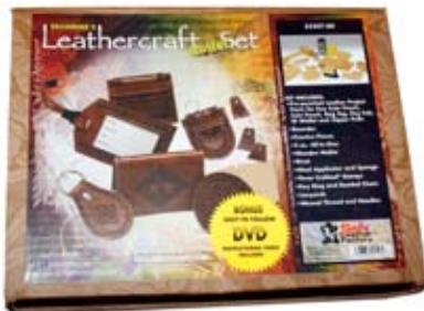
13. Leður byrjendasett 6.961 kr. Verkfæri, efni og upplýsingar til að búa til leðurvörur