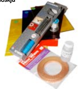
12. Tiffany's glersett 16.650 kr. Byrjendasett; lóðbolti 80w+tínrúlla+5kg gler + koparband + lóðvatn.