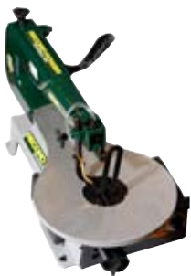
10. Tífsög Record stiglaus 44.732 kr. Tífsögin er gott tæki fyrir alla handverksmenn