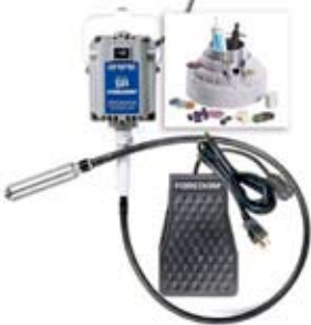
7. Foredom slípvél 64.803 kr. Vönduð vél sem hentar í formun og slípun í tré eða málm.