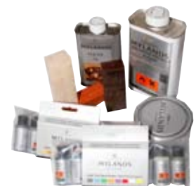
15. Yfirborðsefni sérvalið Frábærar lausnir til að loka og lita við af öllum gerðum