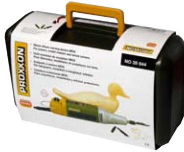
5. Tálguvélín Proxxon 29.865 kr. Léttir tréútskurðinn og nóg úrval af hnífum