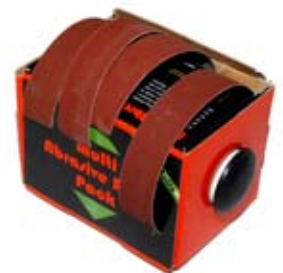
15. Sandpappírsett 2.950 kr. Vandaður og hentugur pappír í 4 grófleikum