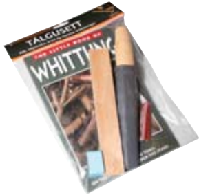
4. Tálguasett 5.850 kr. Hnífur, sniðug verkefnabók, brýni og íslenskar tálguleiðbeiningar