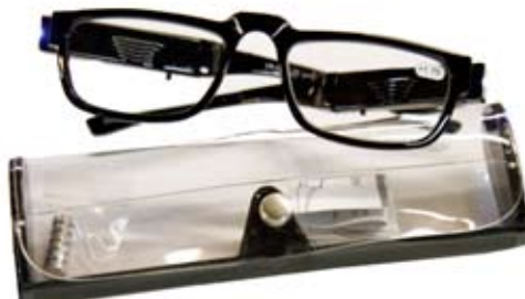
2. Gleraugu m. Ljósi 3.950 kr. Margir styrkleikar í boði + 6 auka rafhlöður