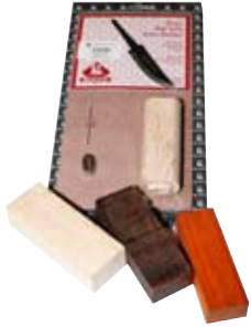
1. Hnífasmiðisett 8.941 kr. Skemmtilegt að búa sér til eigin hníf og slíður