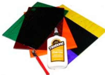
11. Mósaík glerpakki 5.850 kr. Hentar vel í mósaík hönnun - 5kg gler + hnifur + lím