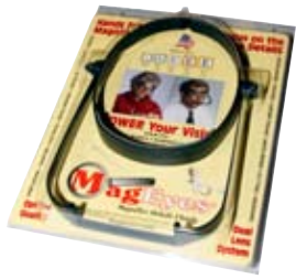
1. Stækkunargler 5.850 kr. Handfrjálst á hausinn og með tveimur styrkleikum