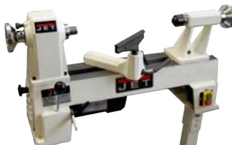
11. Rennibekkur Jet 99.000 kr. Að renna í tré er vinsæl iðja hjá karlmönnum með tíma