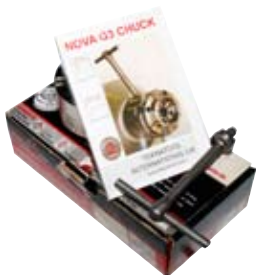
13. Rennipartóna Nova G3 37.500 kr. Passar á alla tré-rennibekki með millistykki