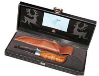
9. Veiðihnifir Brusletto 12.900 kr Vandaðir hnifar í gjafaöskju