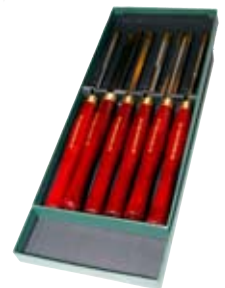
12. Rennijárnasett 32.950 kr. Gott byrjendasett með 6 járnnum.