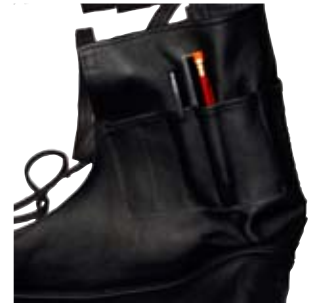
3. Leðursvunta 16.943 kr. Sérsumuð úr léttri nautshúð og hönnuð fyrir handverksmanninn