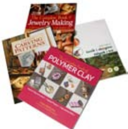
10. Handverksbækur Mikið úrval af vönduðum kennslu og hugmyndabókum