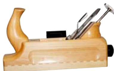
14. Tréhefill 29.880 kr. Listasmiður elskar góðan hefil, þessi er alveg spes.