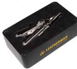
8. Leatherman Wave 17.967 kr. • 19 gæðaverkfæri • 25 ára ábyrgð