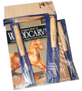
3. Útskurðarpakki Pfeil + kennslubók + linditré 19.500 kr.