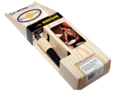
6. Brennipenni 7.630 kr. + brennibók 2.354 kr Frábær í skreytingar og erkingar á tré