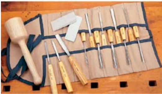
4. Verkfærapoki leður 9.660 kr. Góður fyrir útskurðarjárnin, 16 vasar úr nautshúð.