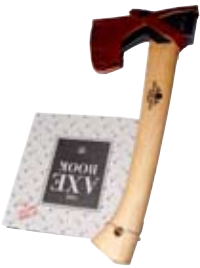
7. Tálguöxin 14.900 kr. + Tálgubókin íslenska 2.756 kr.