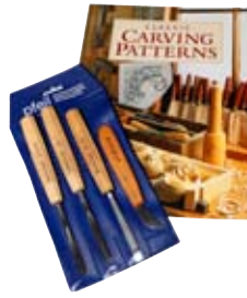
2. Útskurðarsett 12.997 Gott byrjendasett fyrir tréahugamanninn