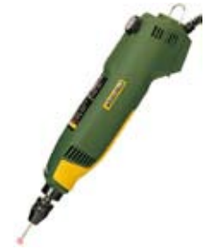
6. Proxxon fræsari 14.850 Nauðsynlegur í allt handverk